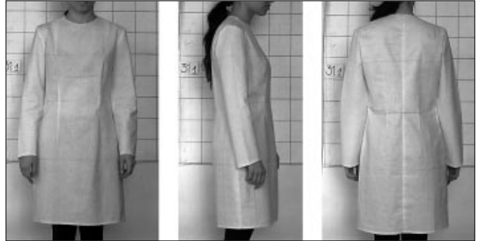
Рис. 3. Изделие хорошего качества посадки

В процессе разработки конструкции система выполняет условия технологичности (сопряженности и накладываемости срезов), проставляет контрольные соединительные знаки и закладывает величины технологических деформаций в соответствии со свойствами материала. При этом заданные условия будут выдержаны во всех размерах и ростах. Затем по разработанному алгоритму автоматически разрабатываются лекала, определяется их пло-